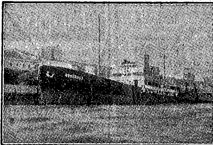
Le « Generoso » en rade de Gènes